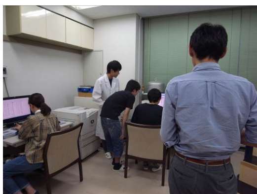
岩手大学生ユーザーとも交流